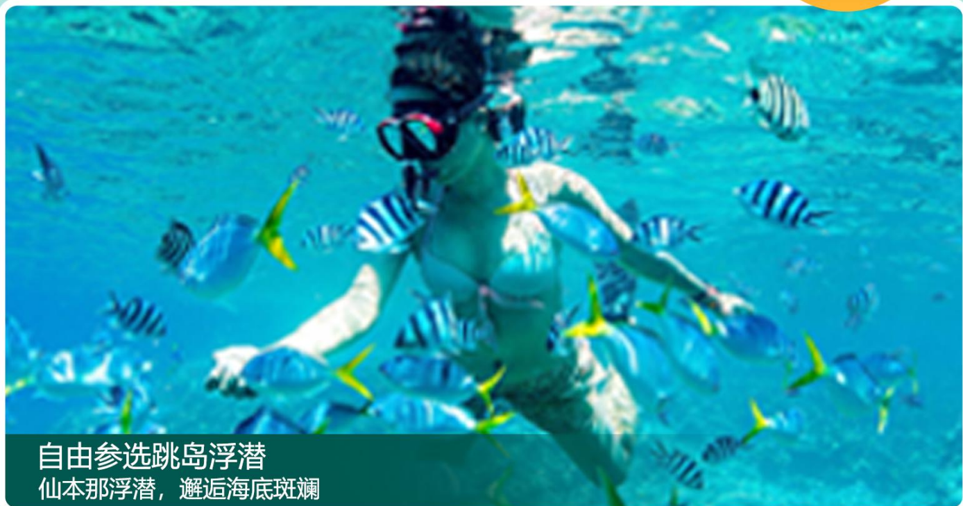
自由参选跳岛浮潜 仙本那浮潜，邂逅海底斑斓