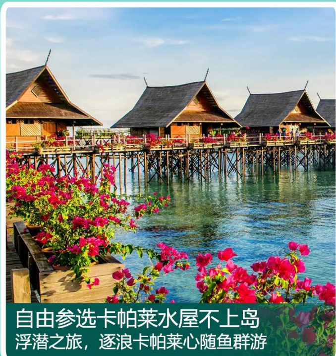
自由参选卡帕莱水屋不上岛 浮潜之旅，逐浪卡帕莱心随鱼群游