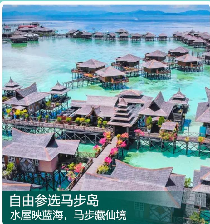
自由参选马步岛 水屋映蓝海，马步藏仙境