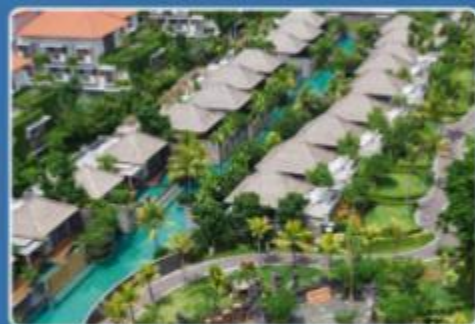
NUSA DUA BEACH 梅鲁萨卡努沙杜瓦