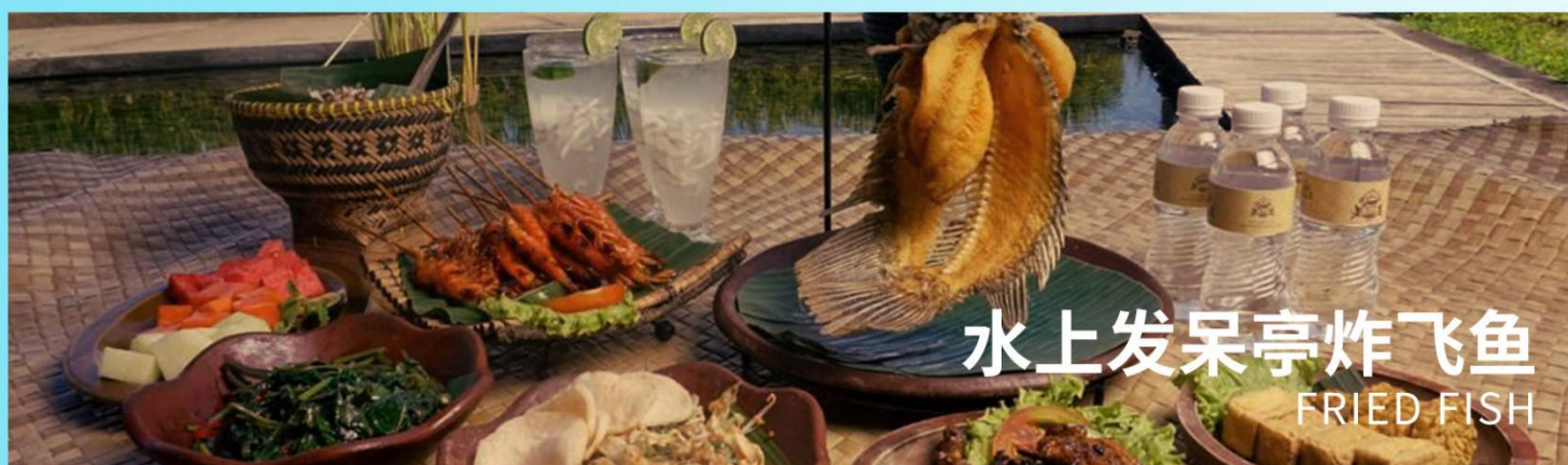
水上发呆亭炸飞鱼 FRIED FISH