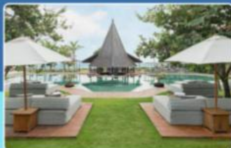
Sadara Resort 巴厘岛萨达拉精品海滩度假村