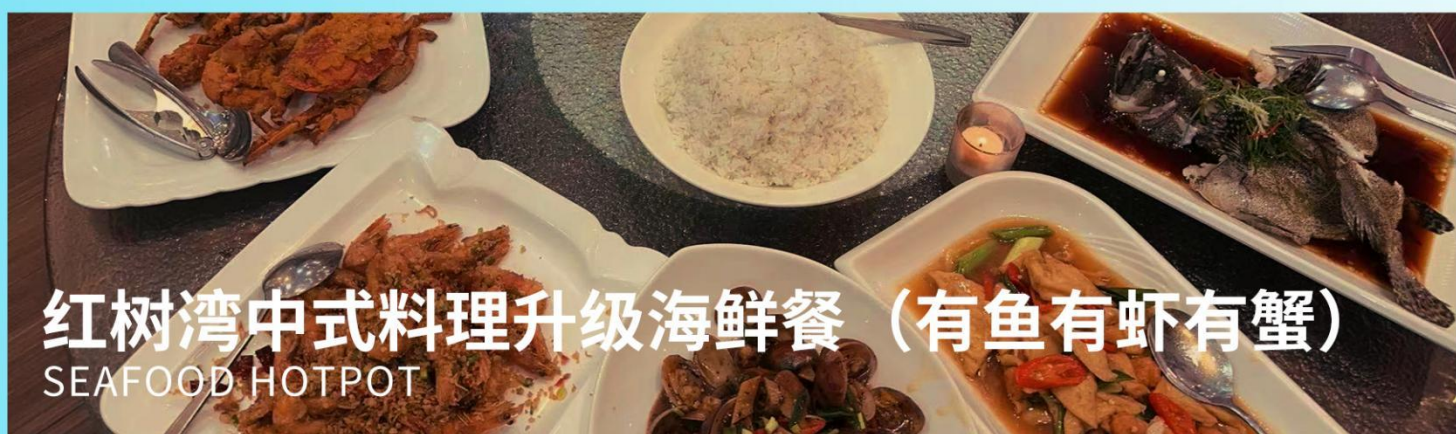
红树湾中式料理升级海鲜餐 (有鱼有虾有蟹) SEAFOOD HOTPOT