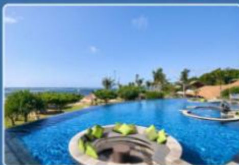
GRAND MIRAGE RESORT 巴厘岛美乐滋度假酒店