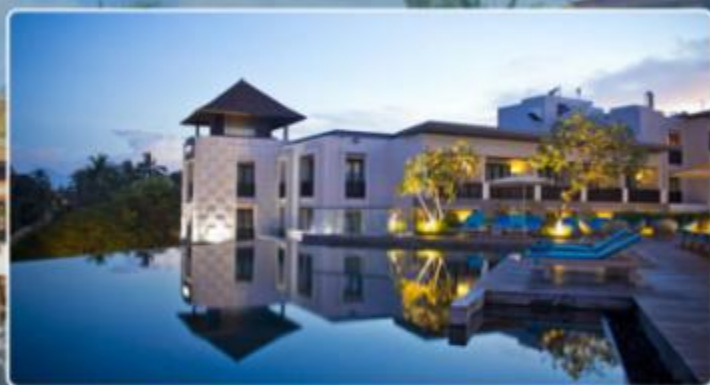
PULLMAN BALI LEGIAN BEACH 巴厘岛勒吉安海滩铂尔曼酒店