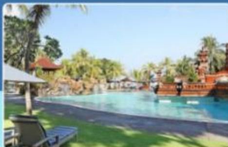
Bintang Bali Resort 宾当巴厘岛度假村