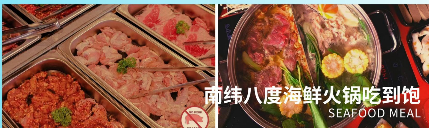
南纬八度海鲜火锅吃到饱 SEAFOOD MEAL