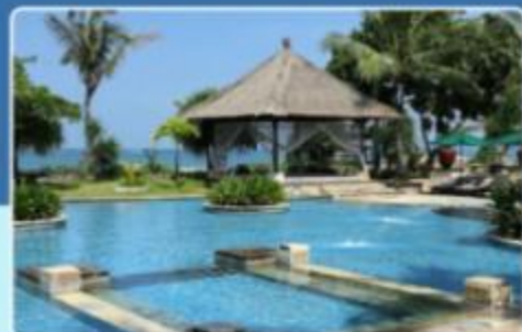
The Patra Bali Resort & Villas 帕特雷巴厘岛度假村及别墅