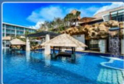
SAKALA RESORT 巴厘岛萨卡拉度假村