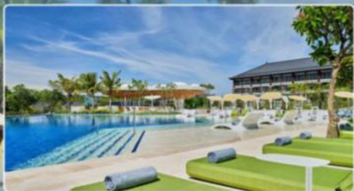
RENAISSANCE NUSA DUA 巴厘岛努萨杜瓦万丽度假村