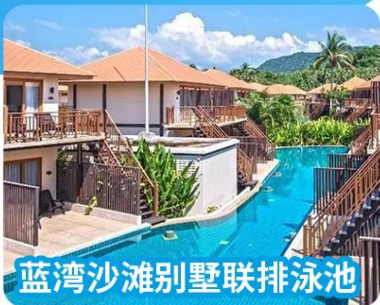
蓝湾沙滩别墅联排泳池