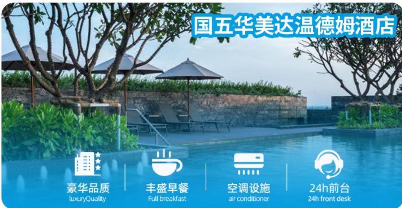
国五华美达温德姆酒店