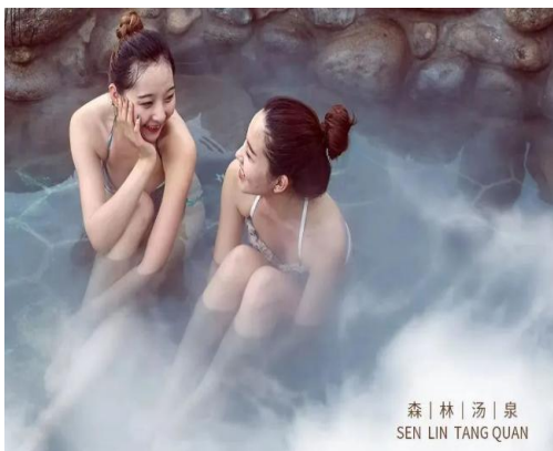
森|林|汤|泉 SEN LIN TANG QUAN

超豪华·铂金五星【清远恒大酒店·泡森林汤泉·恒温游泳池·叹丰盛海鲜自助晚·中西自助早】