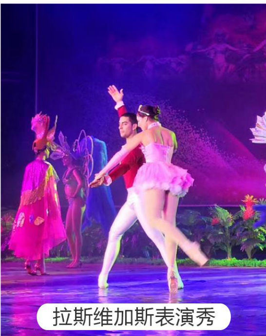
拉斯维加斯表演秀