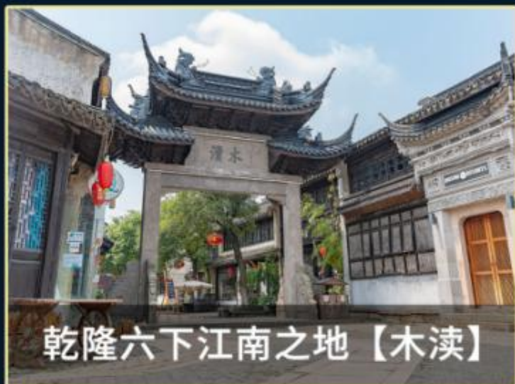
乾隆六下江南之地【木渎】