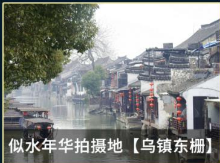
似水年华拍摄地【乌镇东栅】